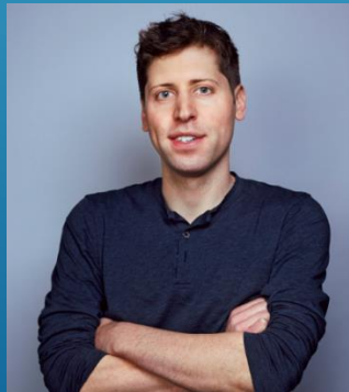
Sam Altman (CEO de OpenAI, creador de ChapGPT)