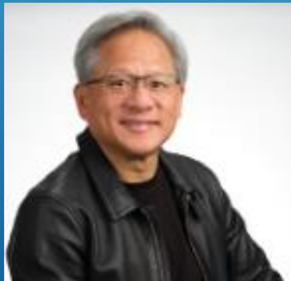
Jensen Huang CEO Nvidia